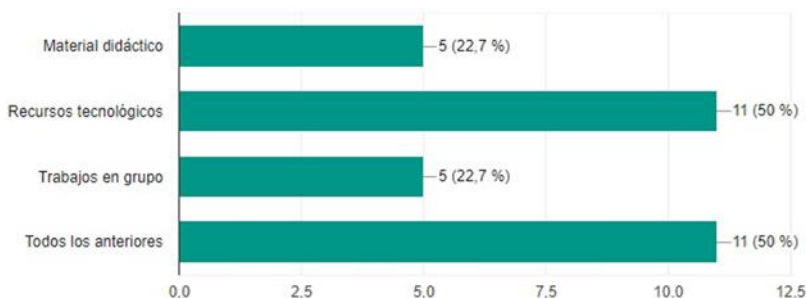
Gráfico 3. Elaboración propia. Diagrama de barras sobre la pregunta 9 de la encuesta realizada a los estudiantes de EGB.

9. ¿Con qué material didáctico le gustaría aprender Lengua y literatura?